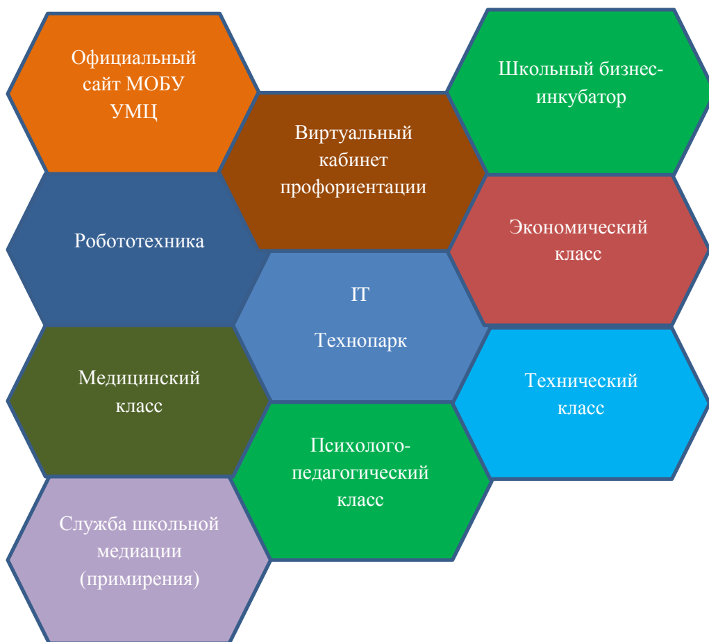
Рисунок 3 – Кванториум МОБУ ДО «Учебно-методический центр»

Профессиональная ориентация и обучение в «кванториуме» строится на базе деятельностно-ориентированного подхода. Для повышения качества формирования компетенций используется две составляющие: